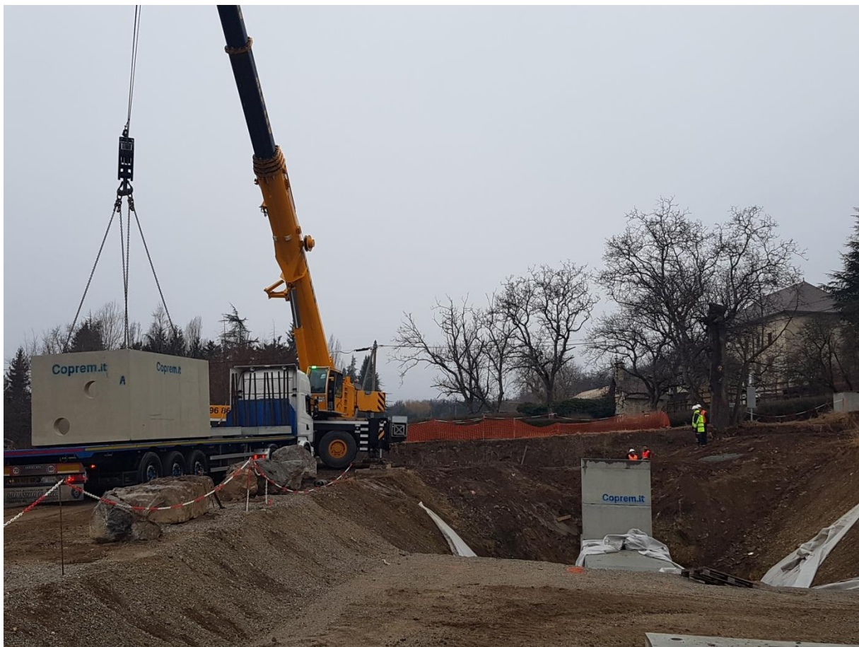
Opérations de mise en place